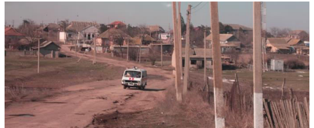
Een ambulance op een onbegaanbare weg in een dorpje