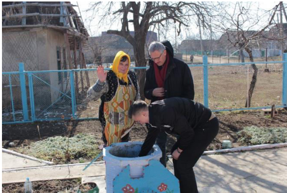
Water uit de waterput